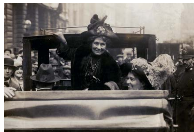
Emmeline Pankhurst und Emmeline Pethick Lawrence, um 1910

Am 19. Januar 1919 konnten Frauen in Deutschland erstmals wählen und sich wählen lassen. Die Jubiläumsausstellung begleitet die Vorkämpferinnen des Frauenwahlrechts vom Kaiserreich bis zur Revolution 1918/19 und verfolgt die Geschichte der ersten Frauenbewegung. Auch die ersten Politikerinnen der Weimarer Republik werden gewürdigt. Das Thema hat an Aktualität nicht verloren.