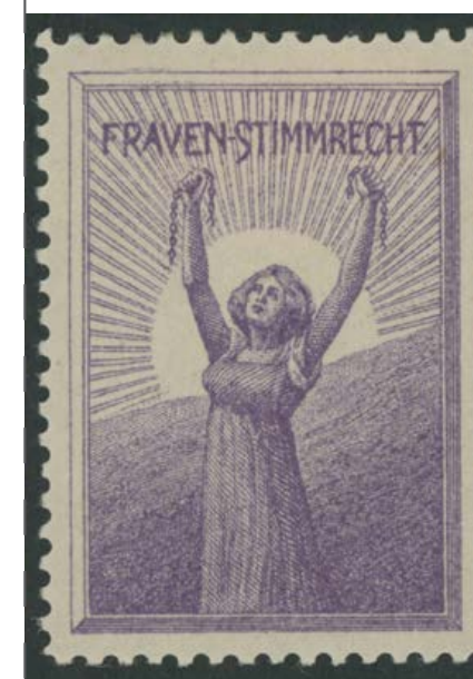
Werbemarke Stimmrecht, um 1910